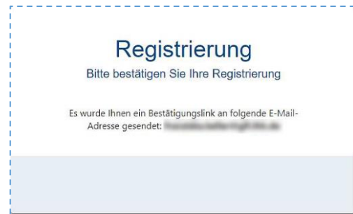
Abbildung 2: Bestätigen der Registrierung

Sollte der Nutzer für die angegebenen Felder andere Angaben machen, als der Inhalt an dem bereits existierenden Benutzerkonto bei einer Vorabfassung, so werden immer die Angaben des Benutzers verwendet. Die bisherigen Werte am vorabfassten Benutzerkonto werden überschrieben.