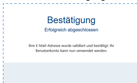
Abbildung 4: Abschließende Bestätigung der Registrierung

Nach der Bestätigung wird dem Prüfer eine Bestätigungsseite angezeigt